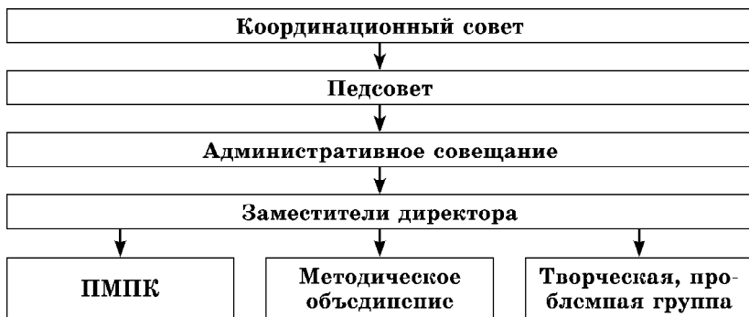
Рис. 3. Модель управления службой в образовательном учреждении (проектная модель)

по проблемам детей группы риска в 4 и 5 классах). Проблемная группа составляет регламент мероприятий в соответствии с поставленными задачами. Во время определения направлений работы специалист службы сразу выступает в активной позиции. Он предлагает свою оценку проблемной ситуации наряду с другими специалистами, формулирует возможные варианты решения и т. п. Он не столько ждет запроса, сколько активно формулирует его, в том числе и для себя. Снимается проблема адекватности запроса, его отсутствия и пр., на которые так часто сетуют специалисты службы сопровождения. На основании плана работ проблемной группы специалист службы сопровождения выстраивает индивидуальный план своей деятельности. Психолог может работать не в одной проблемной группе. К примеру, работа по адаптации к среднему звену может сочетаться с деятельностью в группе по профилактике зависимости от ПАВ, по профильной ориентации девятиклассников и т. д. Все виды работ должны быть сведены в индивидуальный план специалиста, что поможет ему выстроить годовой план работы, где все мероприятия будут согласованы по срокам.